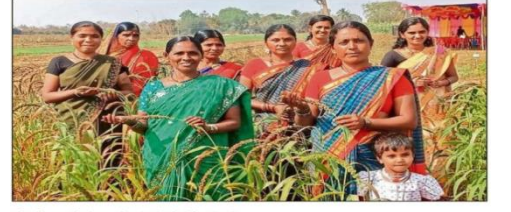
ಬೀಬಿ ಫಾತಿಮಾ ಸಂಘದ ಸದಸ್ಯೆಯರು