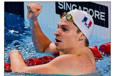
ಚಿನ್ನ ಗೆದ್ದ ಸಂಭ್ರಮದಲ್ಲಿ ಫ್ರಾನ್ಸ್‌ನ ಲಿಯಾನ್ ಮರ್ಷಾನ್ ಎಎಫ್‌ಪಿ ಚಿತ್ರ