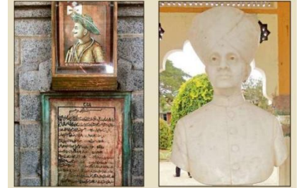
ಅಣೆಕಟ್ಟೆ ದಕ್ಷಿಣ ದ್ವಾರದಲ್ಲಿ ಇರುವ ಟಿಪ್ಪು ಸುಲ್ತಾನ್ ಚಿತ್ರಣಿತ ಫಲಕ (ಎಡಚಿತ್ರ). ಕೆಆರ್‌ಎಸ್ ಬೃಂದಾವನದ ದಕ್ಷಿಣದಲ್ಲಿ, 1940ರ ನಂತರ ಸ್ಥಾಪಿಸಿರುವ ನಾಲ್ವಡಿ ಕೃಷ್ಣರಾಜ ಒಡೆಯರ್ ಅವರ ಪುತ್ಥಳಿ