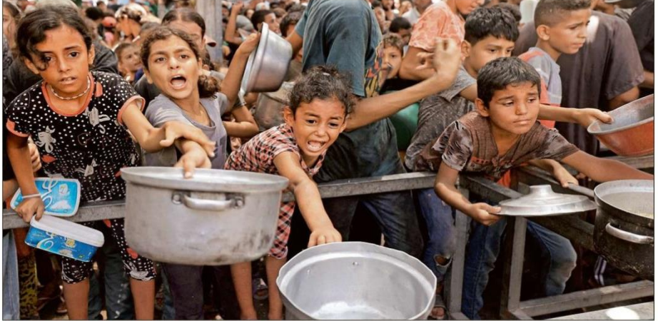
ಹಸಿವು ತಡೆಯಲಾಗುತ್ತಿಲ್ಲ ಊಟ ಕೊಡಿ... ಗಾಜಾ ಪಟ್ಟಿಯ ನಿರಾಶ್ರಿತ ಶಿಬಿರವೊಂದರಲ್ಲಿ ಆಹಾರಕ್ಕಾಗಿ ಮಕ್ಕಳು ಪಾತ್ರೆಗಳನ್ನು ಒಡ್ಡಿದ ಕ್ಷಣ

ಆಧಾರ: ಇಂಟರ್‌ನ್ಯಾಷನಲ್ ರೆಡ್ ಕ್ರಾಸ್, ಬಿಬಿಸಿ, ಗಾರ್ಡಿಯನ್, ವಿಕ್ರಮ್‌ನಿಯ ವರದಿಗಳು, ದಿನಾಂಕ: 2023, ಟೈಮ್ಸ್