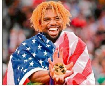
ಅಮೆರಿಕದ ನೋವಾ ಲೈಲ್ಸ್ (ಎಡ) ಡಚ್ ಓಟಗಾರ್ತಿ ಫೆಮ್ ಬೋಲ್ಟ್