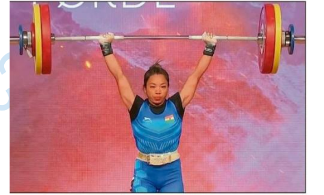
ಭಾರತದ ಮೀರಾಬಾಯಿ ಚಾನು