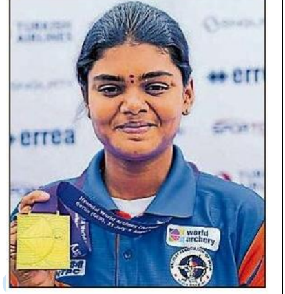
ಚಿನ್ನದ ಪದಕದೊಂದಿಗೆ ಜ್ಯೋತಿ