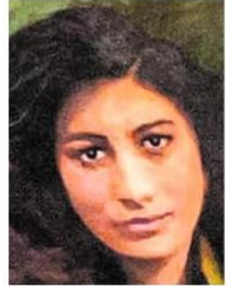
ನೂರ್ ಇನಾಯತ್ ಖಾನ್