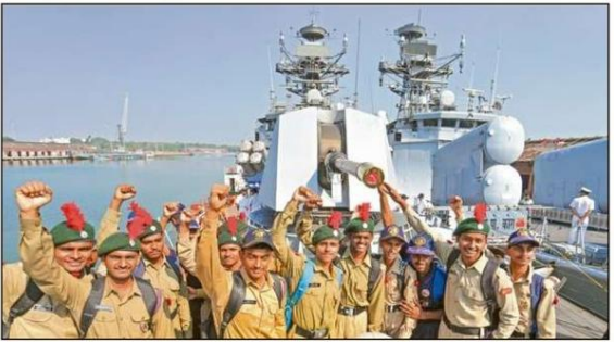
ಕೋಲ್ಕತ್ತದ ಕಿಡ್ನರ್‌ಪೋರ್ ಡಾಕ್‌ನ ಬರ್ತ್‌ಗೆ ಬಂದ ಭಾರತೀಯ ನೌಕಾಪಡೆಯ ಯುದ್ಧನೌಕೆಗಳಿಗೆ ಎನ್‌ಸಿಸಿ ಕಡೆಟ್‌ಗಳು ಭೇಟಿ ನೀಡಿದರು