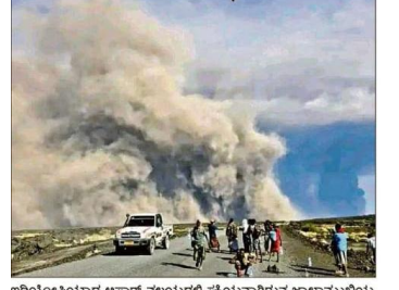
ಇಥಿಯೋಪಿಯಾದ ಅಫಾರ್ ವಲಯದಲ್ಲಿ ಸಕ್ರಿಯವಾಗಿರುವ ಜ್ವಾಲಾಮುಖಿಯ ಬೂದಿ ಆಗಮವನ್ನು ಆವರಿಸಿರುವವರನ್ನು ಸ್ಥಳೀಯರು ದೀಕ್ಷಿಸಿದರು