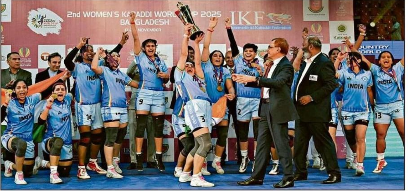
ಕಬಡ್ಡಿ ವಿಶ್ವಕಪ್ ಗೆದ್ದ ಭಾರತ ತಂಡದ ಆಟಗಾರ್ತಿಯರು ಟ್ರೋಫಿಯೊಂದಿಗೆ ಸಂಭ್ರಮಿಸಿದರು

ಸಂದರ್ಭ: ಭಾರತ ವನಿತೆಯರ ಕಬಡ್ಡಿ ತಂಡವು ಫೈನಲ್‌ನಲ್ಲಿ 35-28 ಅಂತರದಿಂದ ತೈವಾನ್ ತಂಡವನ್ನು ಮಣಿಸಿ ಸತತ ಎರಡನೇ ಬಾರಿಗೆ ವಿಶ್ವಕಪ್ ಕಿರೀಟವನ್ನು ಮುಡಿಗೇರಿಸಿಕೊಂಡಿತು.