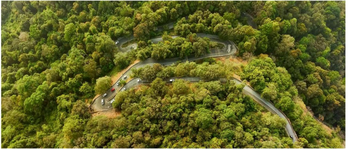
ಆಗುಂಬೆ ಘಾಟಿಯಲ್ಲಿನ ಹಿಮ್ಮುರಿ ತಿರುವುಗಳ ವಿಹಂಗಮ ನೋಟ

ರಾಜ್ಯದ ಕೂವಳಿ ಮತ್ತು ಮೆಲೆನಾದಿನ ಕೊಂಡಿಯಾಗಿರುವ ಆಗುಂಬೆ ಘಾಟಿಯಲ್ಲಿ ಹಾದು ಹೋಗುವ ಕಿರಿದಾದ ರಾಷ್ಟ್ರೀಯ ಹೆದ್ದಾರಿಯನ್ನು ವಿಸ್ತರಿಸಲು ಭೂ ಸಾರಿಗೆ ಮತ್ತು ಹೆದ್ದಾರಿ ಸಚಿವಾಲಯ ಮುಂದಾಗಿದೆ. ವಾದಜಾರಿ ಮಾರ್ಗ ಸಹಿತ ದ್ವಿಪಥ ಹೆದ್ದಾರಿ ಅಥವಾ ಸುರಂಗ ಮಾರ್ಗ ನಿರ್ಮಾಣದ ಕಾರ್ಯನಾಥ್ಯಕ್ಕೆ ಬಗ್ಗೆ ಅಧ್ಯಯನ ನಡೆಸಿ ಸಮಗ್ರ ಯೋಜನಾ ವರದಿ (ಡಿಪಿಆರ್) ಸಿದ್ಧಪಡಿಸಲು ಟೆಂಡರ್ ಕರೆದಿದೆ. ಆಗುಂಬೆಯಲ್ಲಿ ಸುರಂಗ ನಿರ್ಮಾಣ ಪರಿಸರಕ್ಕೆ ಮಾರಕವಾಗಿರುವುದು ಎಂದು ಪರಿಸರವಾದಿಗಳು ಎಚ್ಚರಿಸಿದ್ದಾರೆ. ಉಡುಪಿ-ಶಿವಮೊಗ್ಗ ಜಿಲ್ಲೆಗಳ ನಡುವೆ ಸುಗಮ ಸಂಚಾರಕ್ಕೆ ರಸ್ತೆ ಅಭಿವೃದ್ಧಿ ಅಗತ್ಯ ಎಂದು ಜನಪ್ರತಿನಿಧಿಗಳು ವಾದಿಸುತ್ತಿದ್ದಾರೆ. ಈ ವಿಚಾರವು ಪರಿಸರ ಮತ್ತು ಅಭಿವೃದ್ಧಿ ನಡುವಿನ ಜರ್ಜೀಯನ್ನು ಹುಟ್ಟುಹಾಕಿದೆ