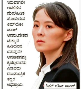
ಕಿಮ್ ಯೋ ಜಾಂಗ್

ದೇಶದ ರಾಜಕೀಯ, ಸೇನಾ ವಲಯದಲ್ಲಿ ಇವರಿಗೆ ಅಚಾರ ಬೆಂಬಲಿಗರಿದ್ದಾರೆ ಎಂದೂ ಹೇಳಲಾಗುತ್ತಿದೆ. ಅಣ್ಣ ಇರುವಾಗಲೇ ಆಡಳಿತದ ಮೇಲೆ ಹಿಡಿತ ಹೊಂದಿರುವ ಕಿಮ್ ಯೋ ಜಾಂಗ್ ಅವರು, ದೇಶದ ಚುಕ್ಕಾಣಿ ಹಿಡಿಯುವ ಯಾವುದೇ ಅವಕಾಶವನ್ನು ಕೈಚೆಲ್ಲಲಾರರು ಎಂಬುದು ರಾಜತಾಂತ್ರಿಕ ತಜ್ಞರ ಅಭಿಪ್ರಾಯ.