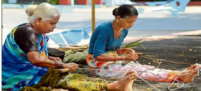
ಬುಟ್ಟಿ ಹಣೆಯಲು ಬಿಳಲು ಸ್ವಚ್ಛ ಮಾಡುತ್ತಿದ್ದ ಕೊರಗ ಮಹಿಳೆಯರು