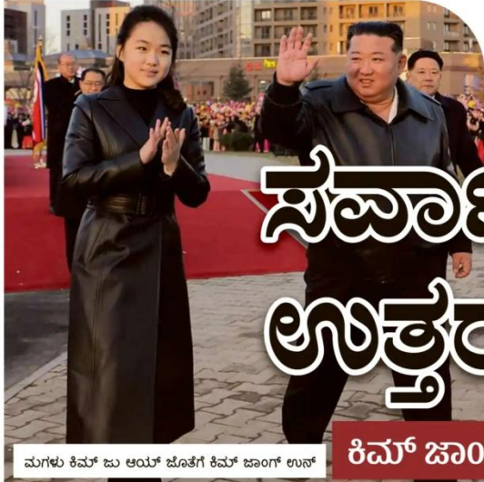
ಮಗಲು ಕಿಮ್ ಜು ಆಯ್ ಚೊತೆಗೆ ಕಿಮ್ ಜಾಂಗ್ ಉನ್

ಉತ್ತರ ಕೊರಿಯಾದ ಸರ್ವಾಧಿಕಾರಿ ಕಿಮ್ ಜಾಂಗ್ ಉನ್ ಅವರು ಉತ್ತರಾಧಿಕಾರಿಯಾಗಿ ತಮ್ಮ ಹದಿಹರೆಯದ ಮಗಳನ್ನು ನೇಮಿಸಲು ಪ್ರಯತ್ನ ನಡೆಸುತ್ತಿದ್ದಾರೆ ಎನ್ನುವ ಮಾಹಿತಿ ಹೊರಬಿದ್ದಿದೆ. ಮುಂದಿನ ದಿನಗಳಲ್ಲಿ ಪಟ್ಟಕ್ಕಾಗಿ ಕಿಮ್ ಜಾಂಗ್ ಮಗಳು ಮತ್ತು ಅವರ ತಂಗಿ ಕಿಮ್ ಯೋ ಜಾಂಗ್ ನಡುವೆ ವೈವಾಹಿಕ, ಸಂಘರ್ಷ ಏರ್ಪಡುವ ಸಾಧ್ಯತೆ ಇದೆ ಎನ್ನಲಾಗುತ್ತಿದೆ. ಇಬ್ಬರಲ್ಲಿ ಯಾರು ಗದ್ದುಗೆ ಏರಿತರೂ ಅವರು ದೇಶದ ಮೊದಲ ಮಹಿಳಾ ಮುಖ್ಯಸ್ಥರಾಗಲಿದ್ದಾರೆ