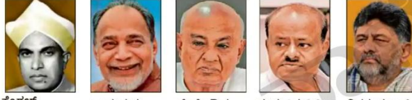
ಕೆಂಗಲ್ ಹನುಮಂತಯ್ಯ ಕೆಂಗಡೆ ರಾಮಕೃಷ್ಣ ಹೆಗಡೆ ದೇವೇಗೌಡ ಕುಮಾರಸ್ವಾಮಿ ಶಿವಕುಮಾರ್

ಕೆಂಗಲ್ ಹನುಮಂತಯ್ಯ, ಶಿವಕುಮಾರ್ ಕಾಂಗ್ರೆಸ್ಸಿಗರು. ಹೆಗಡೆ ಜನತಾ ಪಕ್ಷದವರಾಗಿದ್ದು ದೇವೇಗೌಡ, ಕುಮಾರಸ್ವಾಮಿ ಜೆಡಿಎಸ್‌ನಿಂದ ಈ ಹುದ್ದೆ ಅಲಂಕರಿಸಿದರು.