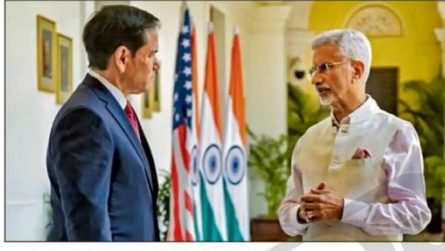
ನವದೆಹಲಿಯಲ್ಲಿ ಭಾನುವಾರ ಅಮೆರಿಕ ವಿದೇಶಾಂಗ ಕಾರ್ಯದರ್ಶಿ ಮಾರ್ಕೋ ರುಬಿಯೋ ಅವರೊಂದಿಗೆ ವಿದೇಶಾಂಗ ಸಚಿವ ಎಸ್.ಜೈಶಂಕರ್ ಅವರು ಮಾತುಕತೆ ನಡೆಸಿದರು