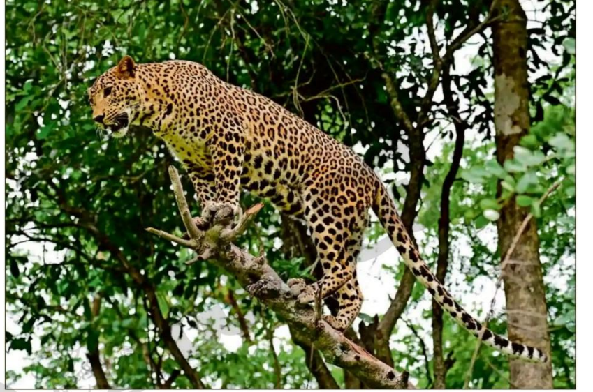
ಬನ್ನೇರುಘಟ್ಟ ಜೈವಿಕ ಉದ್ಯಾನದ ಚಿರತೆ