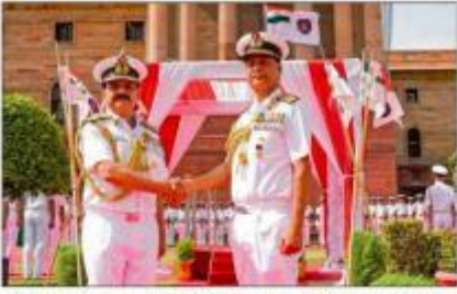
ಸವದೇವಲಿಯಲ್ಲಿ ನಡೆದ ಗೌರವ ವಂದನೆ ಸ್ವೀಕಾರ ಸಮಾರಂಭದಲ್ಲಿ ವೈಸ್ ಆಡ್ಮಿರಲ್ ಅಜಯ್ ಕೋಟ್ಲರ್ ಅವರಿಗೆ ನಿಗದಿತ ವೈಸ್ ಆಡ್ಮಿರಲ್ ಸಹಾಯಕ ವಾಕ್ಯಾಯಲ್ ಅವರು ಮೆಚುಕೊಂಡರು