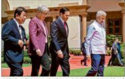
ನವದೆಹಲಿಯಲ್ಲಿ ಮಂಗಳವಾರ ನಡೆದ 'ಕ್ವಾಡ್' ವಿದೇಶಾಂಗ ಸಚಿವರ ಸಭೆಯಲ್ಲಿ ಸಚಿವರೊಬ್ಬರು ಮಾತನಾಡುತ್ತಿರುವ ಸನ್ನಿವೇಶ. ಅಧ್ಯಕ್ಷತೆಯಲ್ಲಿರುವ ಜೈಶಂಕರ್ ಅವರೊಡನೆ ಮಂತ್ರಿಗಳೂ ಇದ್ದಾರೆ.

'ಫೂರ್ವ ಚೀನಾ ಸಮುದ್ರ ಮತ್ತು ದಕ್ಷಿಣ ಚೀನಾ ಸಮುದ್ರದಲ್ಲಿನ ಸಭೆಗಳೇ ಈವಳಕಾರಿಯಾಗಿದೆ. ಈ ಜಲಪ್ರದೇಶದಲ್ಲಿ ಕೈಗೊಳ್ಳುವ ಎಣವಿಧಿಯ ಅಥವಾ ಅಸ್ಥಿರಕೆ ಉಂಟು ಮಾಡುವುದು ಕ್ರಮಗಳಿಗೆ ಸಮ್ಮತಿಸಿದಂತೆ ಇದೆ' ಎಂದು ಹೇಳುವ ಮೂಲಕ, 'ಕ್ವಾಡ್' ರಾಷ್ಟ್ರಗಳು ಚೀನಾಕ್ಕೆ ಪೂರೈಕೆ ಸಂದೇಶ ರವಾನಿಸಿದವು.